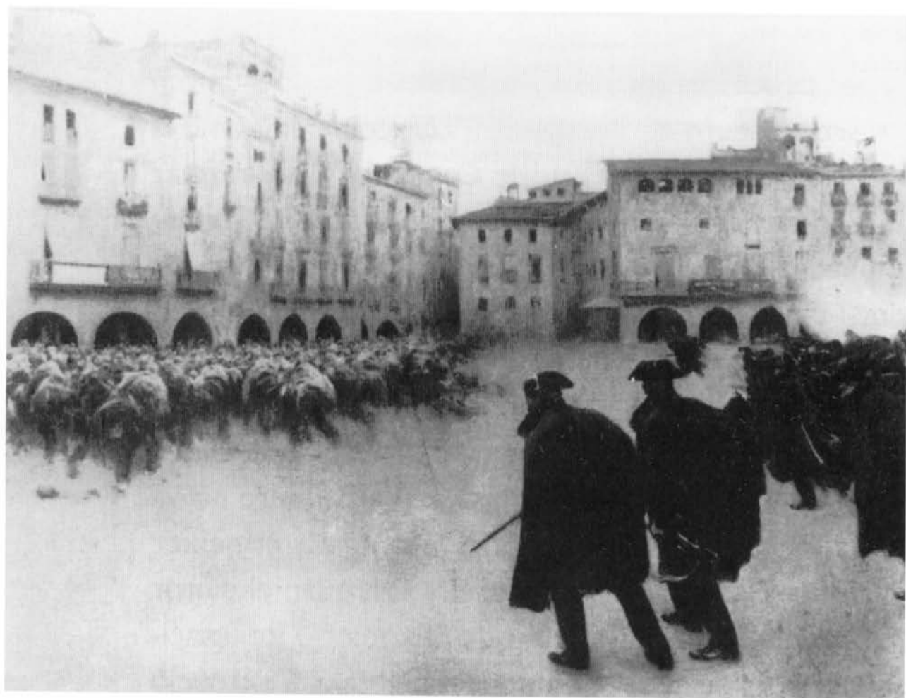
Ramón Casas: La carga

taría con la desaprobación expresa de Pablo Iglesias y de Largo caballero, y que llevaría a la cárcel a Anselmo Lorenzo, entre otros muchos.