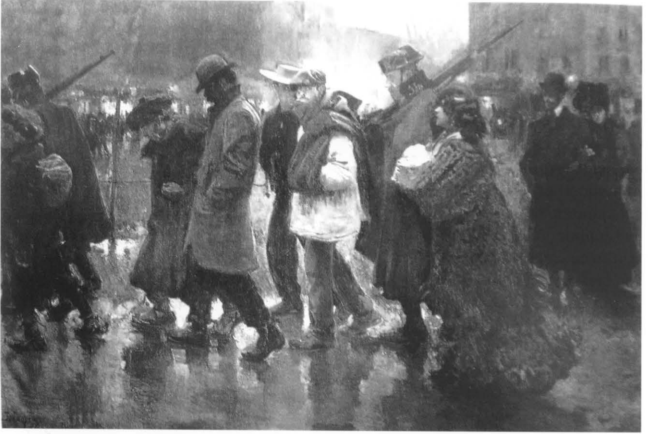
José María López Mezquita: Cuerda de presos