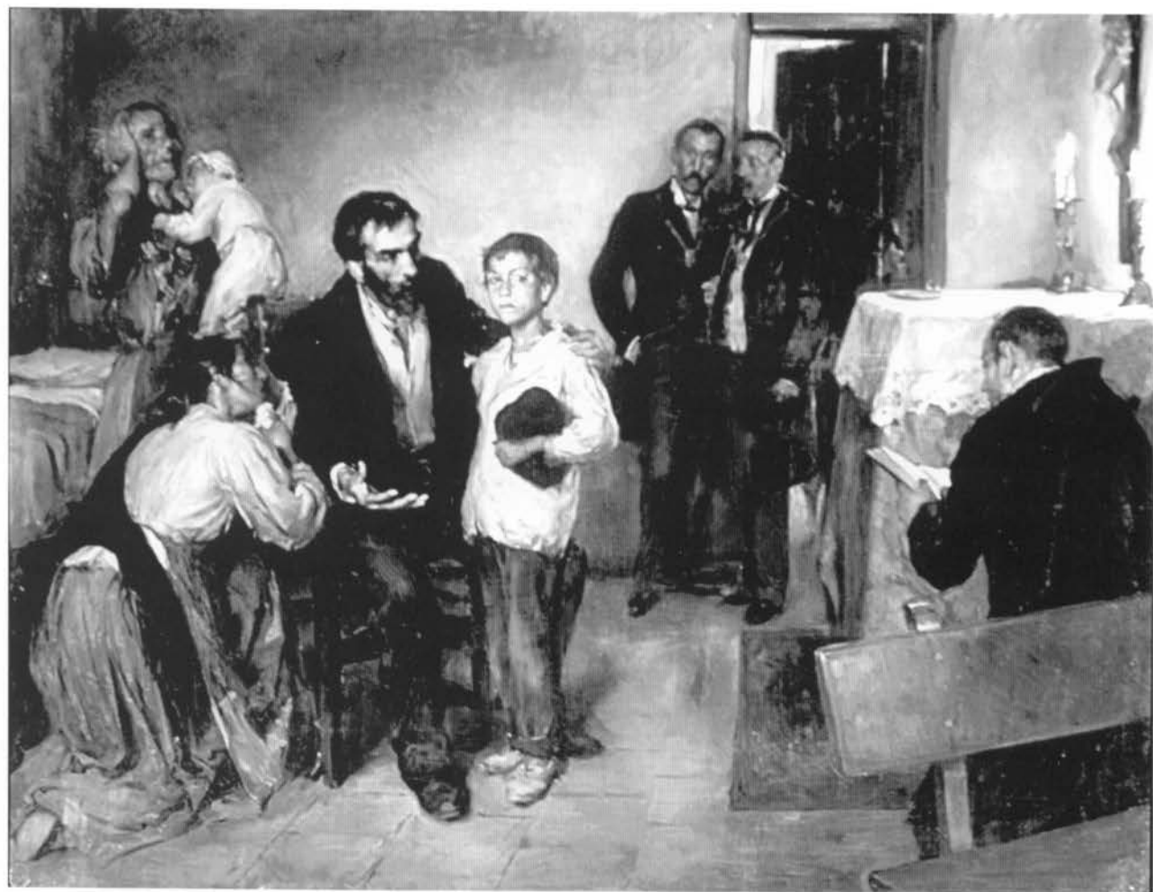
Álvarez de Sotomayor: La familia del anarquista el día de la ejecución

Su versión de LA FAMILIA DEL ANARQUISTA (115 x 150 cm.) se sitúa en