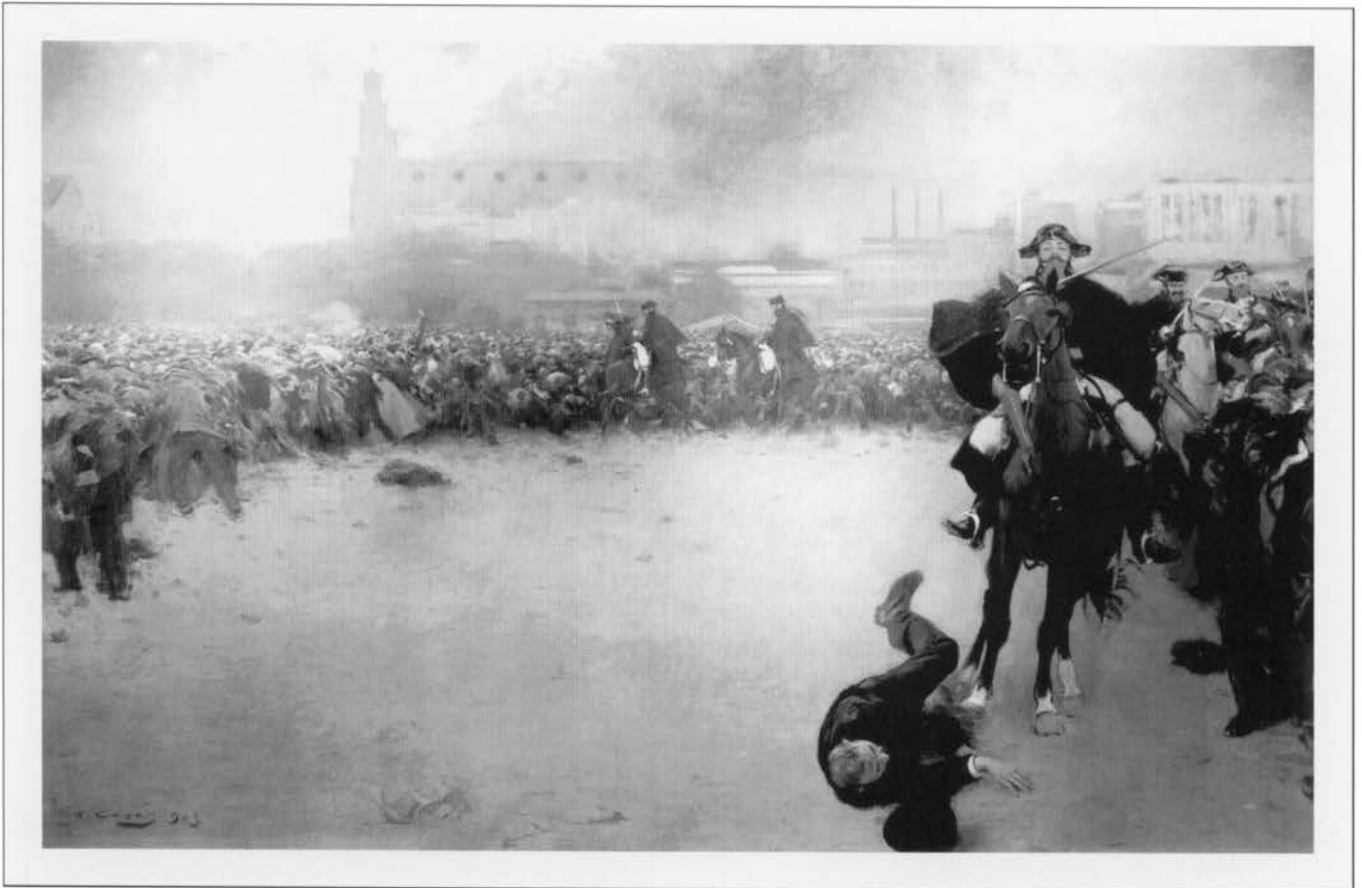
Ramón Casas: Barcelona 1902

obras de una inmensa fuerza descriptiva; y decimos que sólo a medias, porque sólo hemos podido conseguir reproducciones en blanco y negro, ignorando su paradero actual y todos los datos referentes a las mismas.