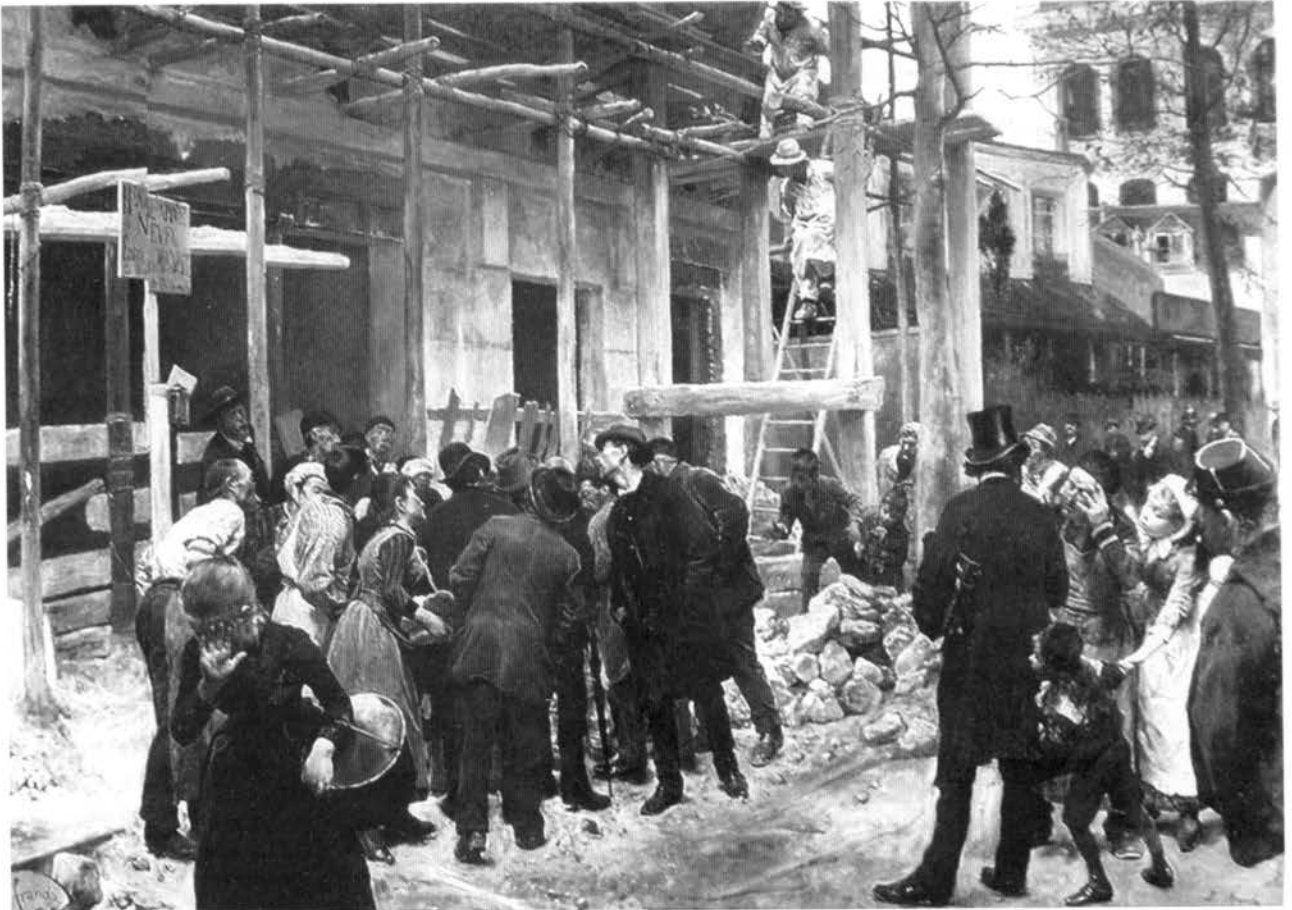
José Jiménez Aranda: Una desgracia

tivo. No puede serlo, ya que los autores a fuer de autodidactas, no pueden jactarse de poseer las titulaciones académicas competentes que respaldarían su autoridad en estos temas. En cualquier caso y ya que vamos a hablar de arte, hemos creído conveniente reducirnos exclusivamente a comentar algunas obras de las que hemos podido obtener representación gráfica, ya que uno de los objetivos principales de éste trabajo es contribuir a su difusión. Las otras, aquellas obras de las que no podemos aportar fotografías, seguirán por el momento durmiendo el sueño de los justos a la espera de que alguien con mas tiempo, recursos y potencialidades investigadoras pueda descubrirnos algún día esa parte de nuestro acervo cultural que hoy yace en el olvido. Un estudio que en verdad está haciendo falta.