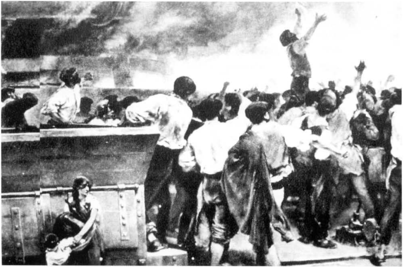
Vicente Cutanda: Una huelga de obreros en Vizcaya