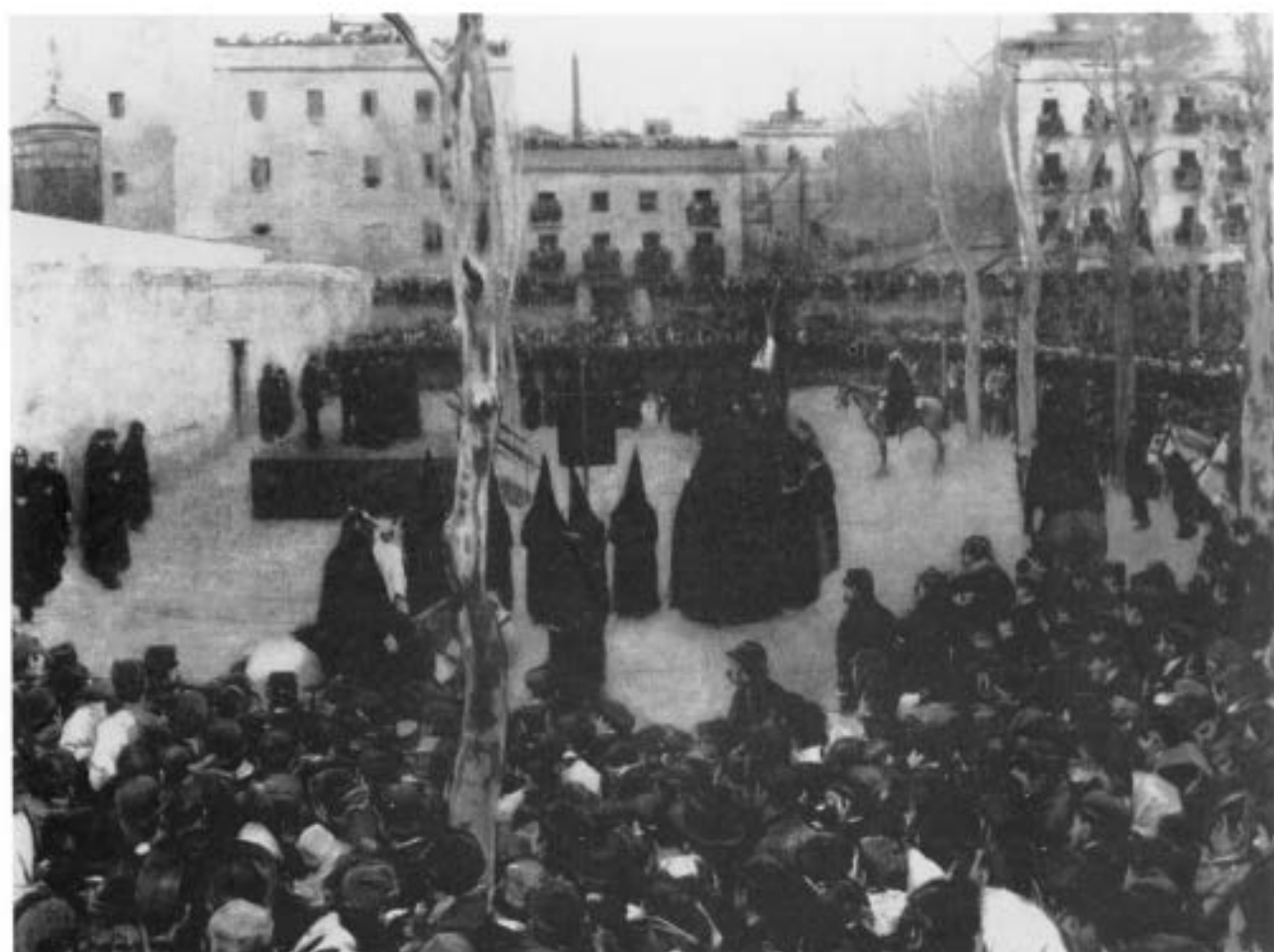
Ramón Casas: Garrote vil

también de nuestras glorias, esperando el día de que alguien descorra el velo que hoy oculta nuestra memoria gráfica.